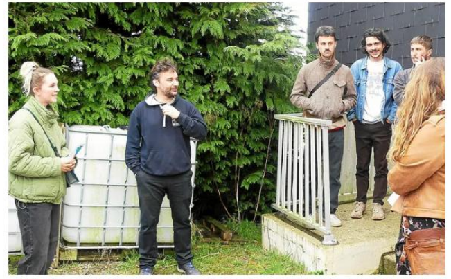
La 10e promotion de porteurs de projets soutenus par l'ESS Pays de Vannes et le Tag 56 démarre en septembre et recherche des porteurs de projets économiques et sociaux motivés.